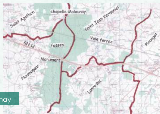
Bois de Malaunay

Aujourd'hui une stèle imposante érigée le long de la RN 12 et inaugurée le 10 juillet 1949 rappelle le sacrifice de ces résistants. Ce monument sera d'ailleurs déplacé lors de la mise en 2X2 voies en 1976.