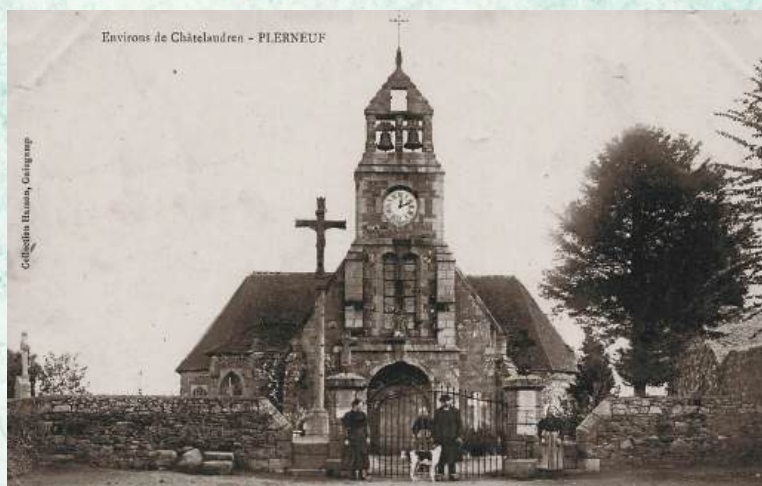
Église de Plerneuf

Il est considéré comme victime civile avec la mention "mort pour la France" . Il est inhumé à Plerneuf.