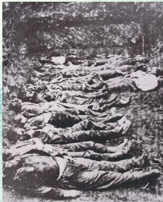
Découverte de la fosse en 1944

Après la libération de la région de Guingamp le 22 août 1944, les corps seront exhumés et présentés aux familles qui feront procéder à leurs funérailles dans leurs communes respectives.