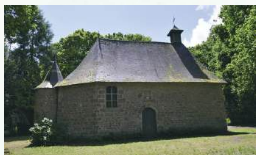
Chapelle de Malaunay

Non fréquenté car entièrement privé, seul le bruit des éoliennes récemment implantées vient troubler le silence un peu pesant de cette sombre sapinière.