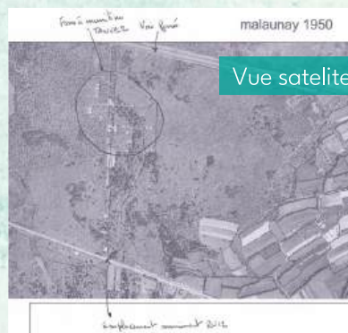
Vue satellite du bois de Malaunay en 1950