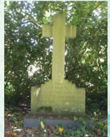
Stèle à proximité de la chapelle de Malaunay

Qui étaient ces malheureuses victimes dont le seul tort fut probablement d'être au mauvais endroit au mauvais moment ?