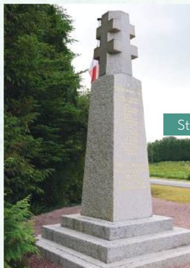
Stèle de Malaunay

Le 7 août 1944, jour de la libération de Guingamp, deux civils de Coat An Doch sont abattus semble-t-il sans raison par l'occupant.