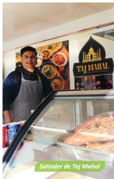
Salinder de Taj Mahal